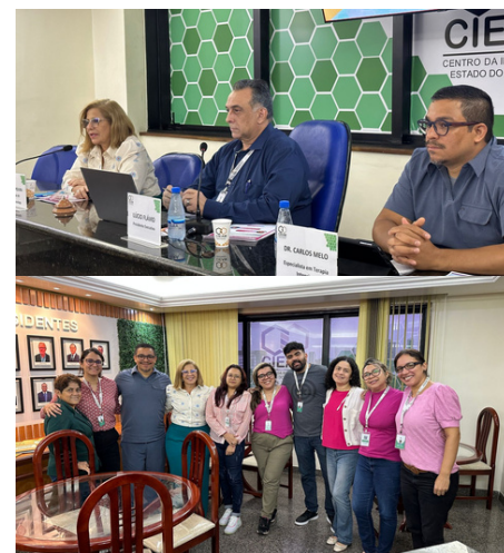
Time do CIEAM engajou o tema e vestiu rosa