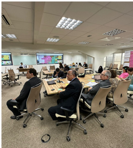
Presidente do Conselho durante oficina de escuta no DF

Grupo identificou áreas e tecnologias para investimentos no setor