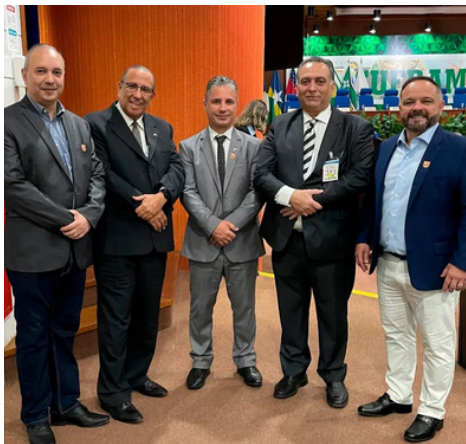
Presidente-Executivo e conselheiros participaram

A presidência do Centro da Indústria do Estado do Amazonas (CIEAM) esteve na primeira Reunião do ano do Conselho de Administração da Suframa (CAS), conduzida nesta sexta-feira (1º) pelo presidente em exercício, Geraldo Alckmin, vice-presidente da República e ministro do Desenvolvimento, Indústria, Comércio e Serviços (MDIC), Geraldo Alckmin. A reunião tem caráter especial em alusão ao 57º aniversário da Zona Franca de Manaus (ZFM) e da Suframa, celebrados oficialmente no dia 28 de fevereiro.