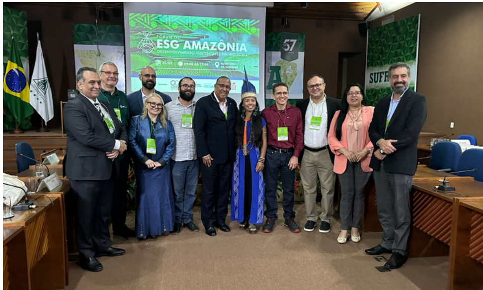
Promovido pelo CIEAM, o Fórum pode ser visto online pelo YouTube da entidade e no app do Amazon Sat

Evento debate de que maneira os princípios do ESG podem ser integrados de forma eficiente nas empresas da região Amazônica e dá bons exemplos