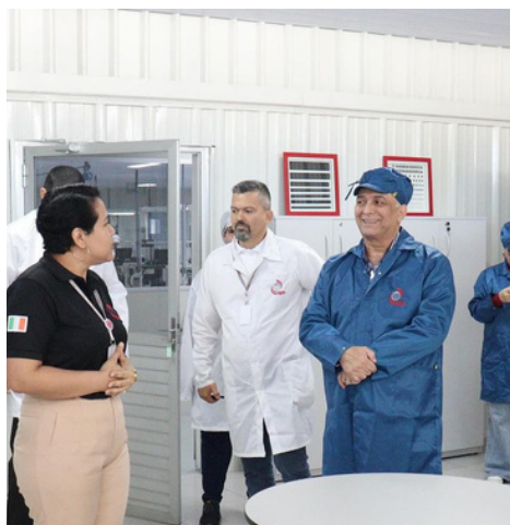
Time da associada apresenta processos da EPS em Manaus