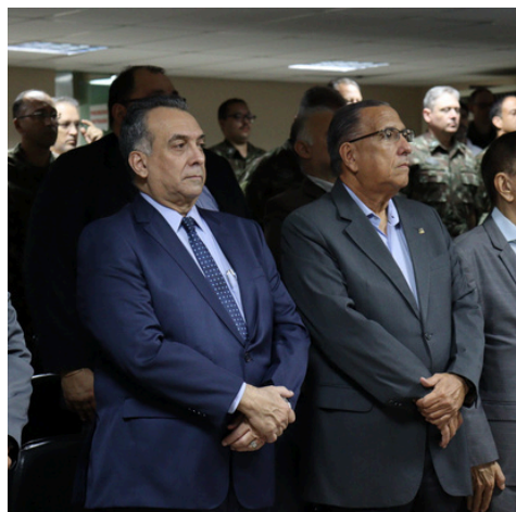
A BDS, associada CIEAM, é um exemplo de EED (Empresa Estratégica de Defesa) amazonense

Empresas podem se cadastrar para fornecer produtos para o Exército