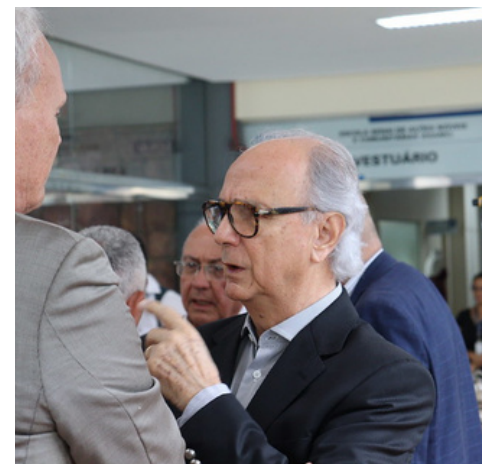
O BIC Up! tem como objetivo acelerar a inovação na planta