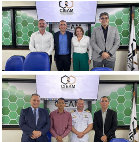
Evento reuniu players e entes governamentais no CIEAM